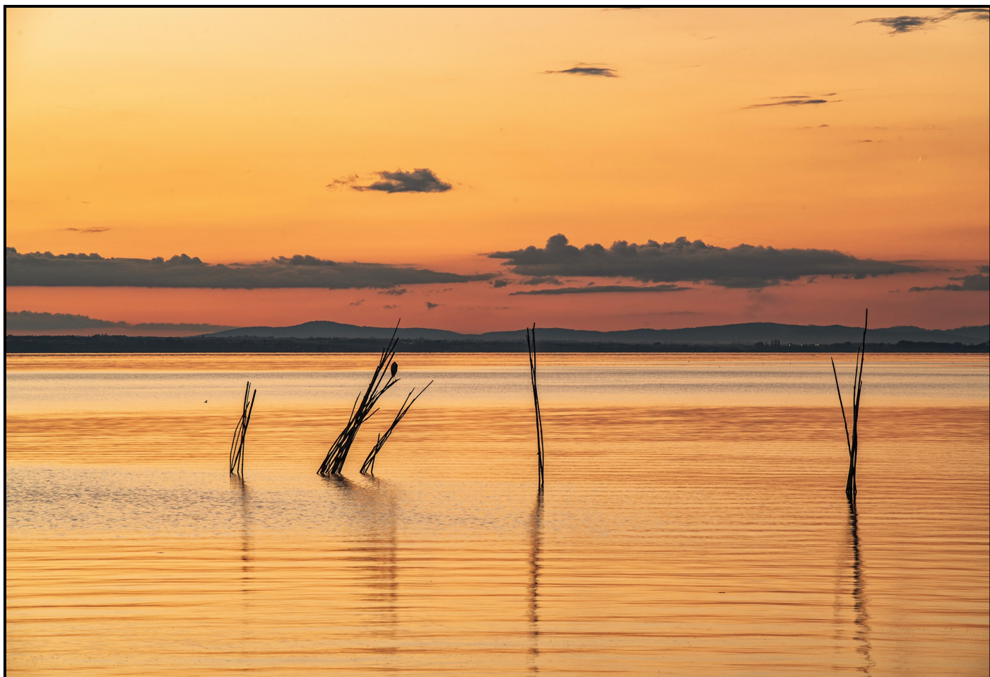
Lago Trasimeno - A San Feliciano il Museo della Pesca