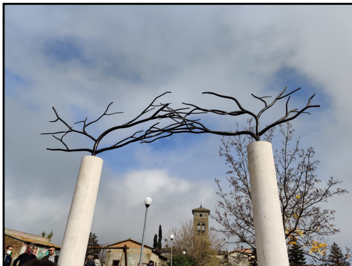
Ugo la Pietra SEGNALE / PORTALE Architettura / Natura

resto della colonna, che salendo va definendosi in modo più geometrico, esprime la sapienza della lavorazione artigianale che in questi luoghi si è protratta per secoli e ne ha rappresentato l'espressione primaria del Genius loci contribuendo anche a definire le forme e le strutture dei luoghi più identitari per la comunità. Infine, l'elemento in ferro che sovrasta le due colonne intrecciandosi è un chiaro omaggio alla produzione agricola, in particolare delle viti che tra Torgiano e Brufa è particolarmente fiorente e che insieme agli ulivi hanno ormai definito l'antropizzazione di un nuovo ambiente, quello che oggi ci appare in tutta la sua forza in queste colline dolci dell'Umbria centrale. Una scultura, dunque, che sa sintetizzare in pochi, ma ricercati elementi, la natura stessa del luogo e che con questo avvia un dialogo fatto di rimandi storici, punti fissi del presente, aprendo al contempo una porta verso un orizzonte futuro. (Lorenzo Fiorucci)