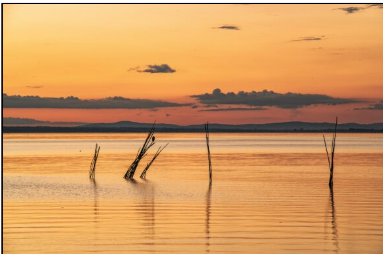
Il Lago Trasimeno - Il quarto lago più grande d'Italia