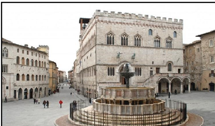
Perugia - Piazza IV Novembre

Continua fino al 31/01/2021 l'iniziativa del Comune di Perugia che, a partire dal 23 dicembre 2020, prevede incontri digitali sulle principali piattaforme social (canale Youtube, Facebook, e il giovedì su Instagram) per promuovere la cultura in questo difficile periodo storico caratterizzato da pesanti restrizioni. La nuova proposta delle Biblioteche Comunali di Perugia prevede incontri digitali e video consigli di lettura di numerosi libri disponibili in una delle sei librerie della Città e su MediaLibraryOnLine , la biblioteca digitale gratuita. I prossimi appuntamenti utili sono previsti per i giorni Mercoledì 20/01/2021 e 27/01/2021 ore 21:00. Maggiori informazioni possono essere acquisite direttamente sul sito dell'Amministrazione Comunale raggiungibile all'indirizzo http://turismo.comune.perugia.it/articoli/segna-il-libro-video-consigli-di-lettura .