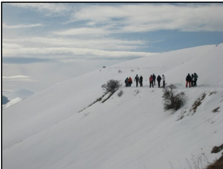
La ciaspolata