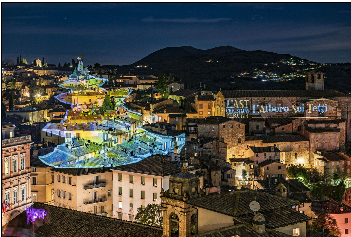
L'AST Christmas Perugia - L'Albero Sui Tetti