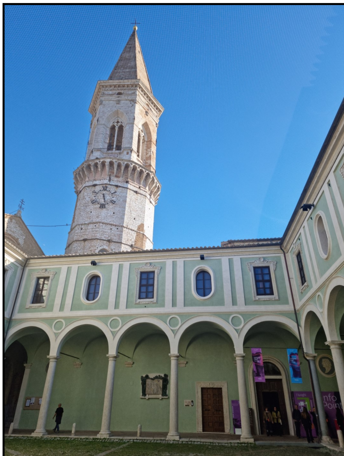
Umbria Libri 2022: XXVIII edizione di Matteo Fortini