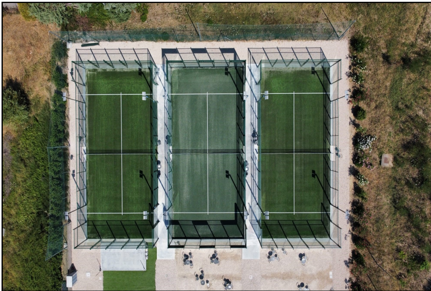
Foto aerea dei nuovi campi di padel di Perugia Loc. Montemorcino