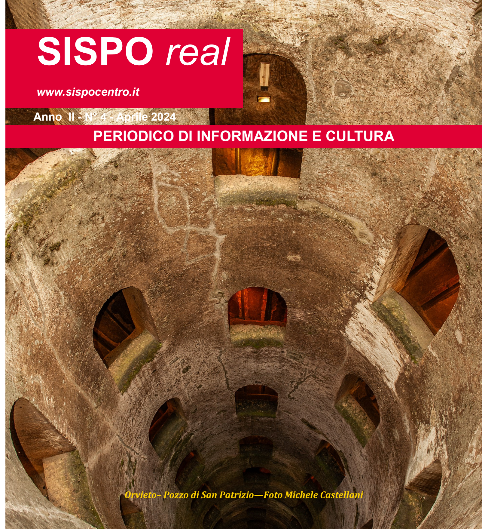
Orvieto- Pozzo di San Patrizio—Foto Michele Castellani