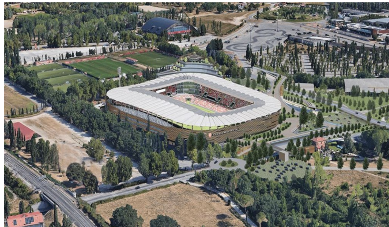
Foto: Immagine del progetto

Il progetto è alla sua seconda presentazione ed è stato riformulato a seguito delle riserve espresse precedentemente dall'amministrazione comunale di Perugia a causa dell'ingente impegno finanziario richiesto e della necessità di trovare una collocazione temporanea alle partite del Perugia che non fosse troppo lontana dalla città. La versione 2.0 dell'iniziativa si propone come un'iniziativa pubblico-privata che prevede la copertura quasi integrale dei costi da parte dei privati attraverso il Fondo 10 Stati e un apporto del Comune ridotto rispetto alla versione precedente. Quale sede temporanea del campionato di calcio viene individuato lo stadio di Ponte San Giovanni, opportunamente adeguato, e non più Gubbio come precedentemente ipotizzato. (E.G.)