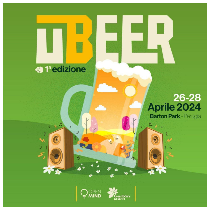
Immagine: locandina dell'evento

L'accesso al festival è libero e gratuito e i partecipanti potranno acquistare il ticket che consentirà di ottenere il kit ufficiale del festival comprensivo di 10 token validi in tutti gli stand dei birrifici e foodtruck, la pettorina ufficiale del festival e il bicchiere da birra. (Matteo Fortini)