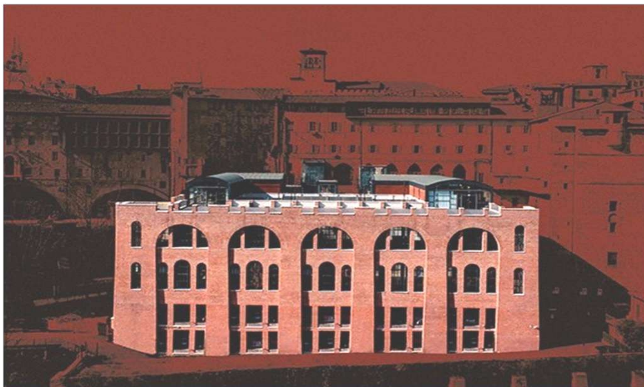
EX-MERCATO COPERTO - PERUGIA