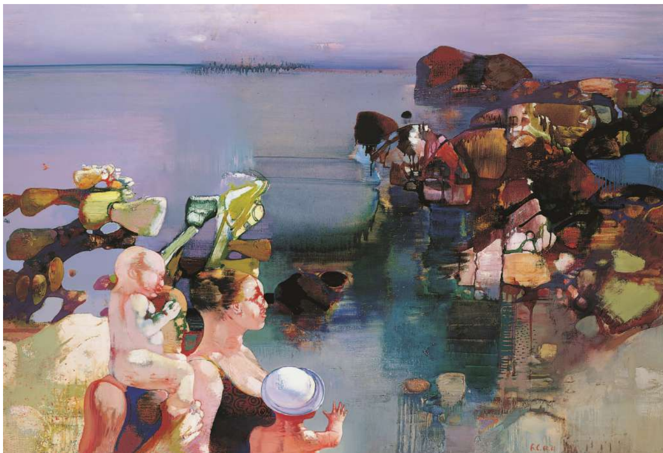
Leonardo Cremonini, Passeggiata al Belvedere - 1960-61 olio su tela 103x174 - Collezione privata.