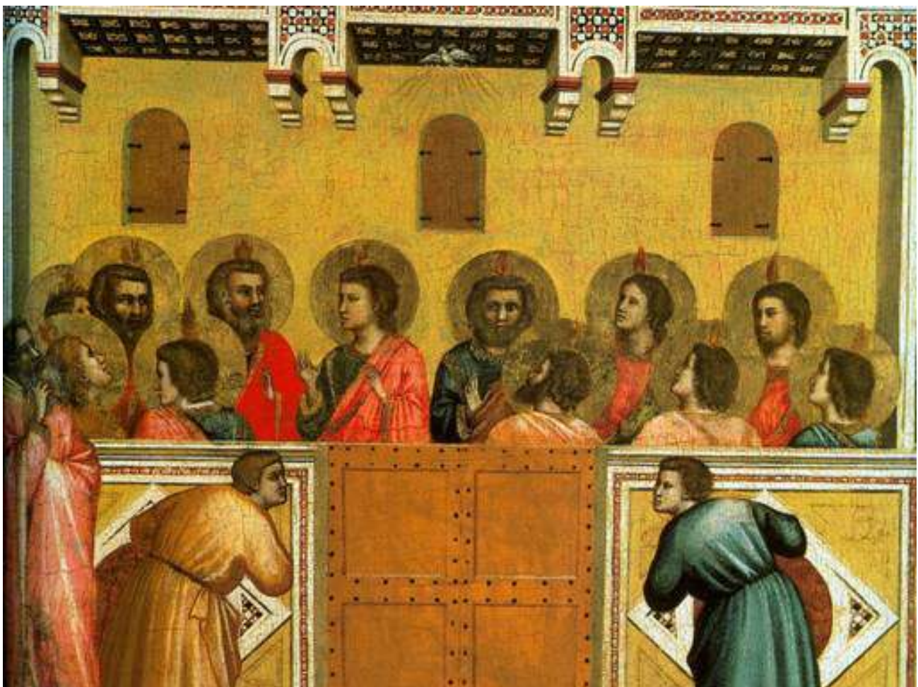
Giotto e Bottega, Pentecoste , National Gallery Londra