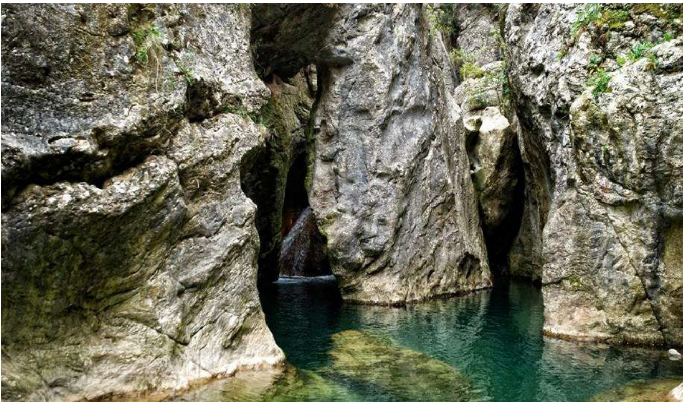
Parrano, le Tane del diavolo

Il geologo italiano, nato a Massa Marittima nel 1847 e membro del Regio Comitato Geologico, è celebre per la mappatura dettagliata della Toscana e dell'Umbria. Egli rilevò da solo 22 fogli della Carta Geologica d'Italia, inclusi 16 della Toscana e 6 dell'Umbria. La sua fama si deve anche alle scoperte minerarie: favorì lo sviluppo estrattivo in Toscana e al Monte Amiata, scoprendo il grande giacimento piritoso di Gavorrano e rendendo noti i giacimenti cinabrieri di Abbazia San Salvatore e Pereta. Promosse le attività estrattive nelle Colline Metallifere, identificò filoni calaminari e mineralizzazioni cuprifere a Massa Marittima, Boccheggiano e Gavorrano ed elaborò delle descrizioni dettagliate delle sorgenti termali che fornirono basi scientifiche per lo sfruttamento balneare e lo sviluppo di stabilimenti termali. L'Antica Querciolaia e San Giovanni a Rapolano in Toscana, sono divenuti famosi e molto frequentati al pari di quelli più antichi di Chianciano e Saturnia e dei numerosi centri umbri, come le acque sulfuree che si mescolano nel fiume Nera dei Bagni di Triponzo a Cerreto di Spoleto, il Bagno del Diavolo , forra naturale con acque termali a Parrano, le Terme di Rasiglia, situate nel caratteristico borgo dei ruscelli, le Terme Francescane di Spello e poi Fontecchio (Città di Castello), San Faustino (Massa Martana), San Gemini. L'opera di Lotti resta un riferimento per la geologia regionale, influenzando generazioni di studiosi fino ad oggi. (Elena Garghella)