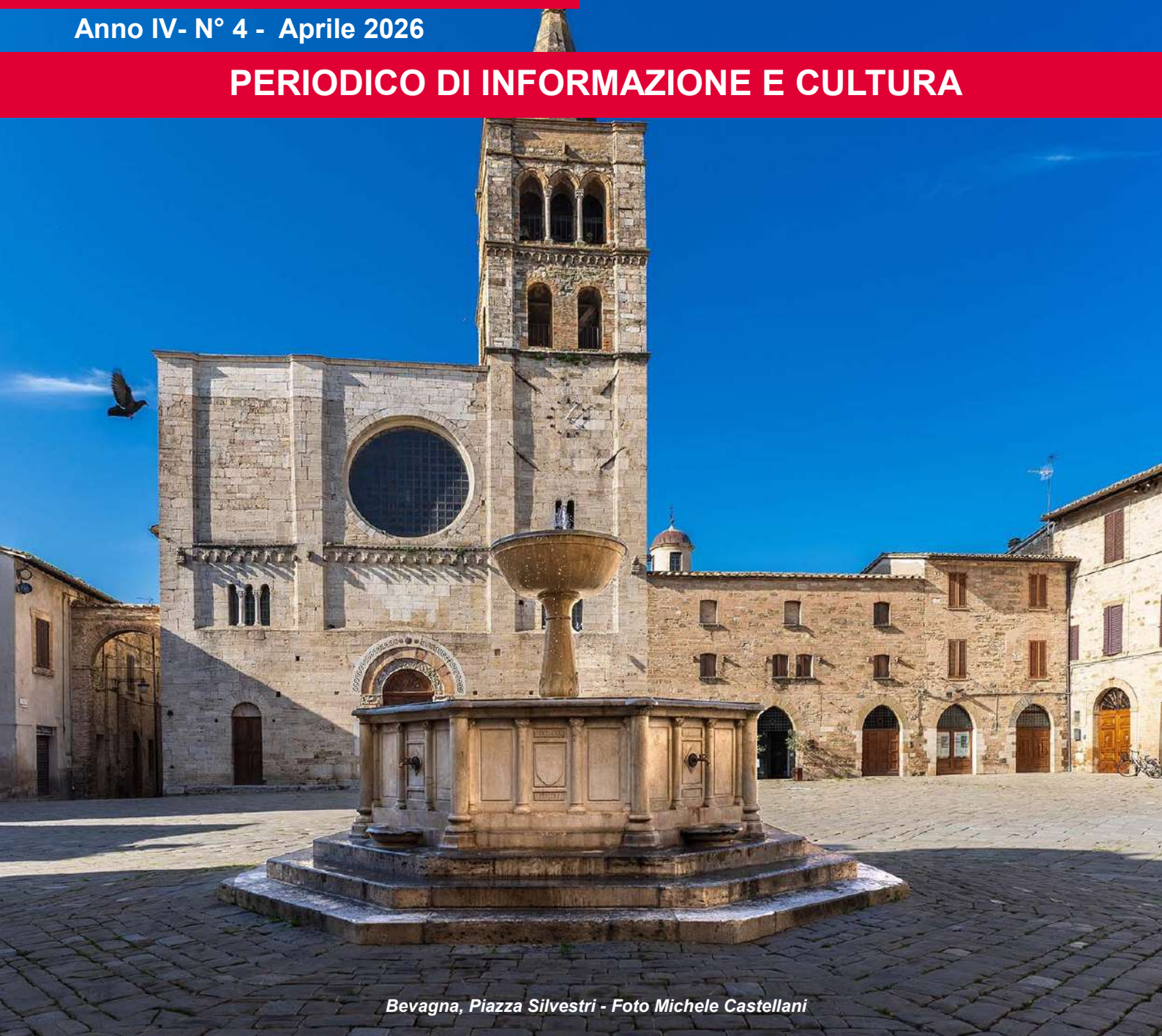
Bevagna, Piazza Silvestri